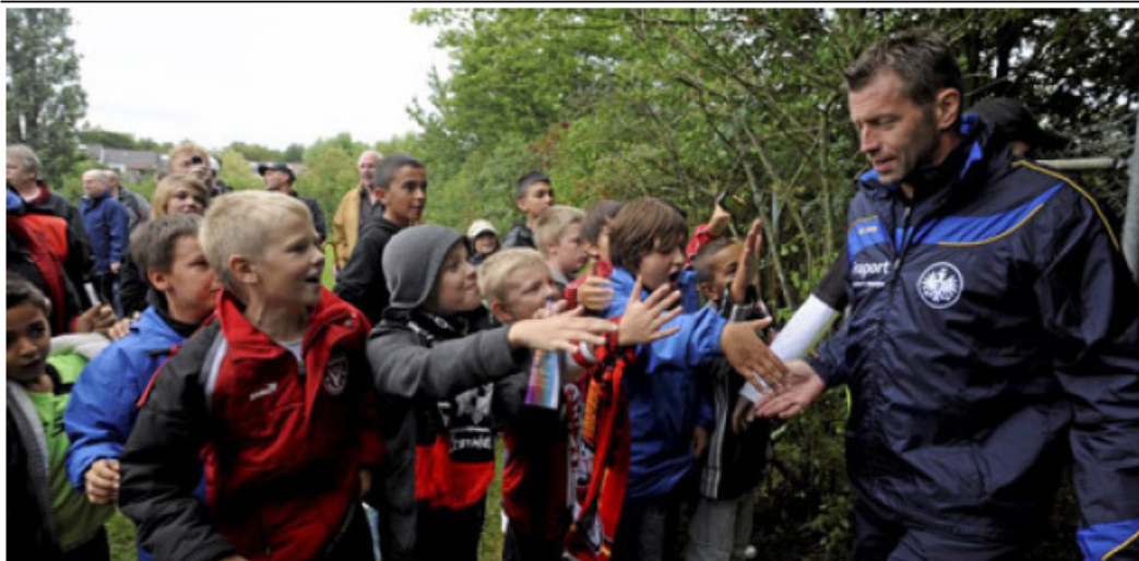
Die Kinder strecken Michael Skibbe die Hände entgegen: Der Eintracht-Trainer hatte allerhand Knirpse abzuklatschen.

Vor 1300 Zuschauern geben sich nicht alle Eintracht-Spieler so volksnah und leutselig wie ihr Trainer